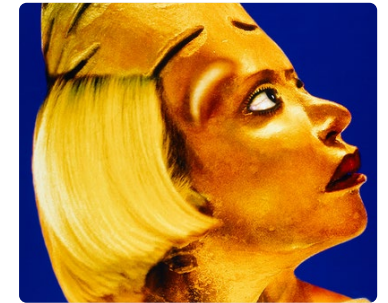
Micro-Folie Dives-sur-Mer - Refiguration/Self-Hybridation N°2, Adapp, Paris

Techniques : Photographies, logiciel de morphing.