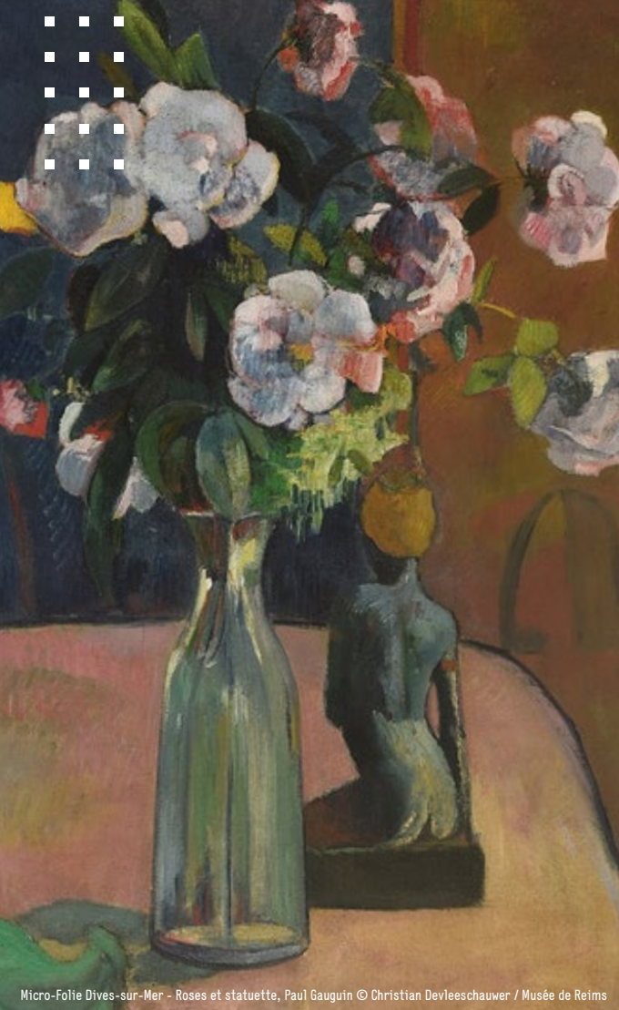
Micro-Folie Dives-sur-Mer - Roses et statuette, Paul Gauguin

service communication NCPA - Ne pas jeter sur la voie publique