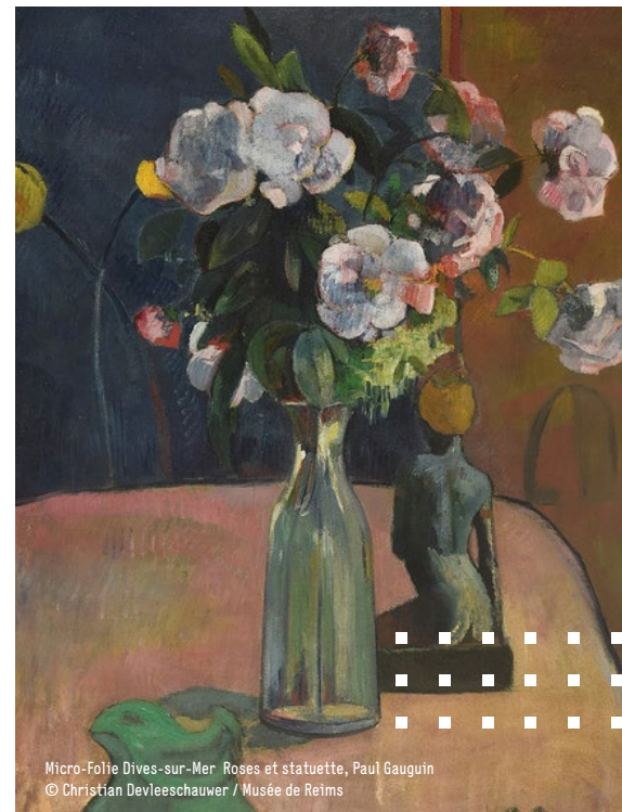
Micro-Folie Dives-sur-Mer Roses et statuette, Paul Gauguin © Christian Devleeschauwer / Musée de Reims

Venez vous initier à la photo en studio : focus sur les fleurs dans l'art avec un travail autour de compositions florales, de mise en scène, d'éclairage et de prise de photos.