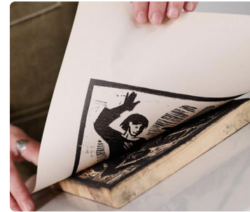
Micro-Folie Dives-sur-Mer - Transfert sur bois