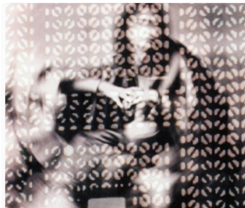
Micro-Folie Dives-sur-Mer Woman, musée de l'IMA, inv. PHO 06-05, don de l'artiste. © Susan Hefuna, Le Caire - 1997

Techniques : Photographies, plotter de découpe, bombes de peinture aérosol.