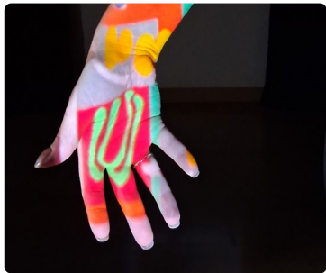
Micro-Folie Dives-sur-Mer Tatouage Ephémère

Techniques : Photographies, gestion des lumières, cadrage.